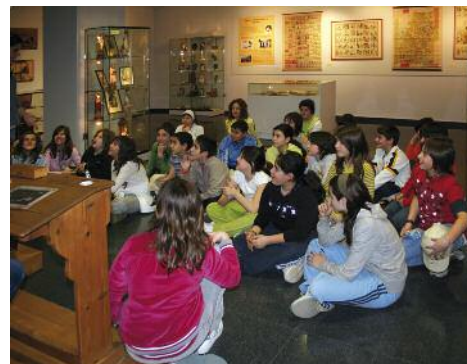
Museo Pedagógico de Aragón

Publicaciones del Museo Pedagógico de Aragón 94