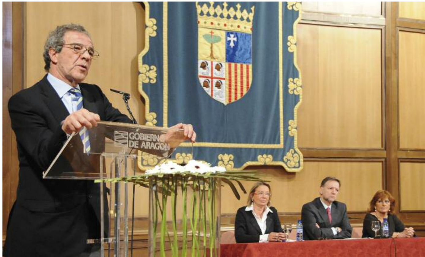
César Alierta, Presidente Ejecutivo de Telefónica S.A. durante el acto de la entrega de medallas del pasado año