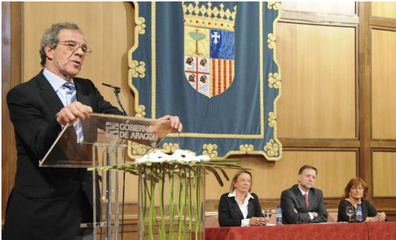
César Alierta, Presidente Ejecutivo de Telefónica S.A. durante el acto de la entrega de medallas del pasado año