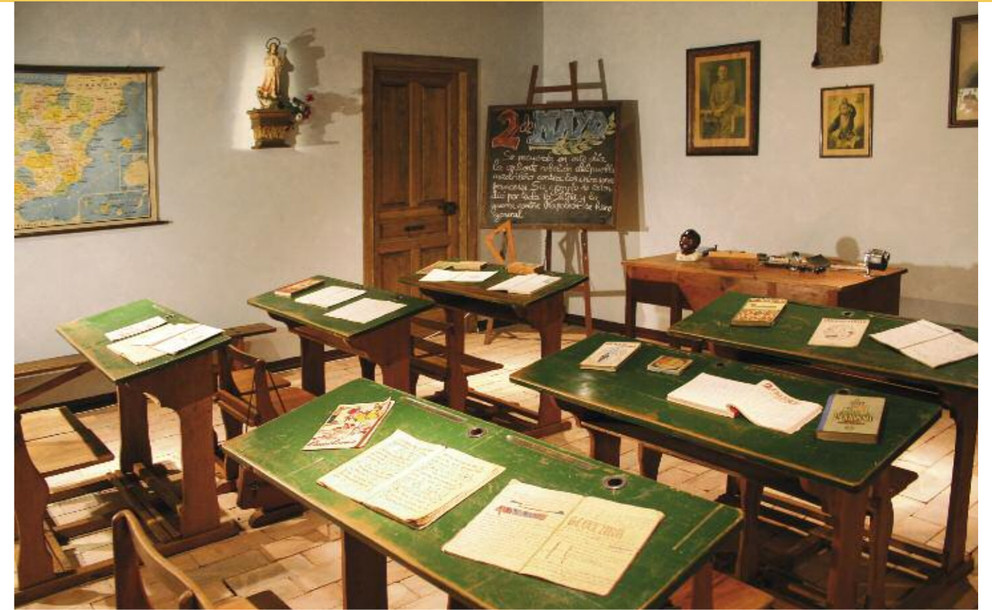
Aula del nacional-catolicismo