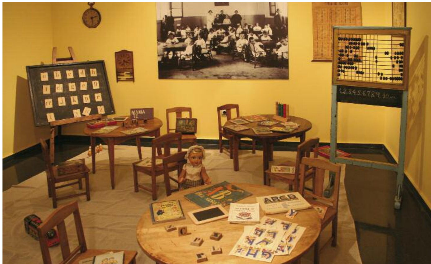
Aula de principios de siglo xx y Aula de primeros aprendizajes

asistir, aunque este precepto fuera frecuentemente incumplido— a la escuela primaria. Por eso podemos decir que las piezas expuestas tienen que ver directamente con nuestras vidas. Y por esta misma circunstancia el Museo Pedagógico de Aragón es un museo abierto, del que pueden hacerse múltiples lecturas en función de la biografía, la formación y los intereses de quienes deciden recorrer sus dependencias.