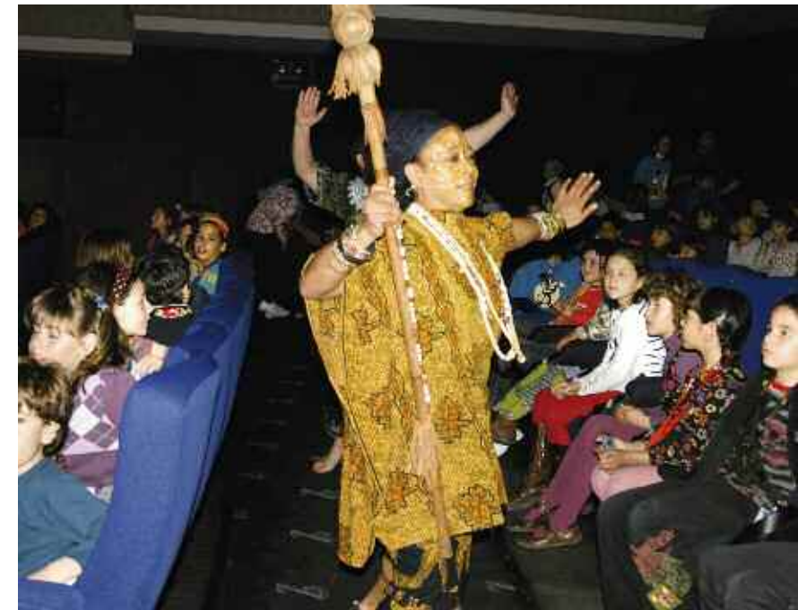
Espectáculo de animación previo a la proyección de la película Kirikú y la bruja

Toda la información relativa a este club se realiza con los medios de comunicación que les son propios a sus miembros: sms, correos electrónicos, internet... Para