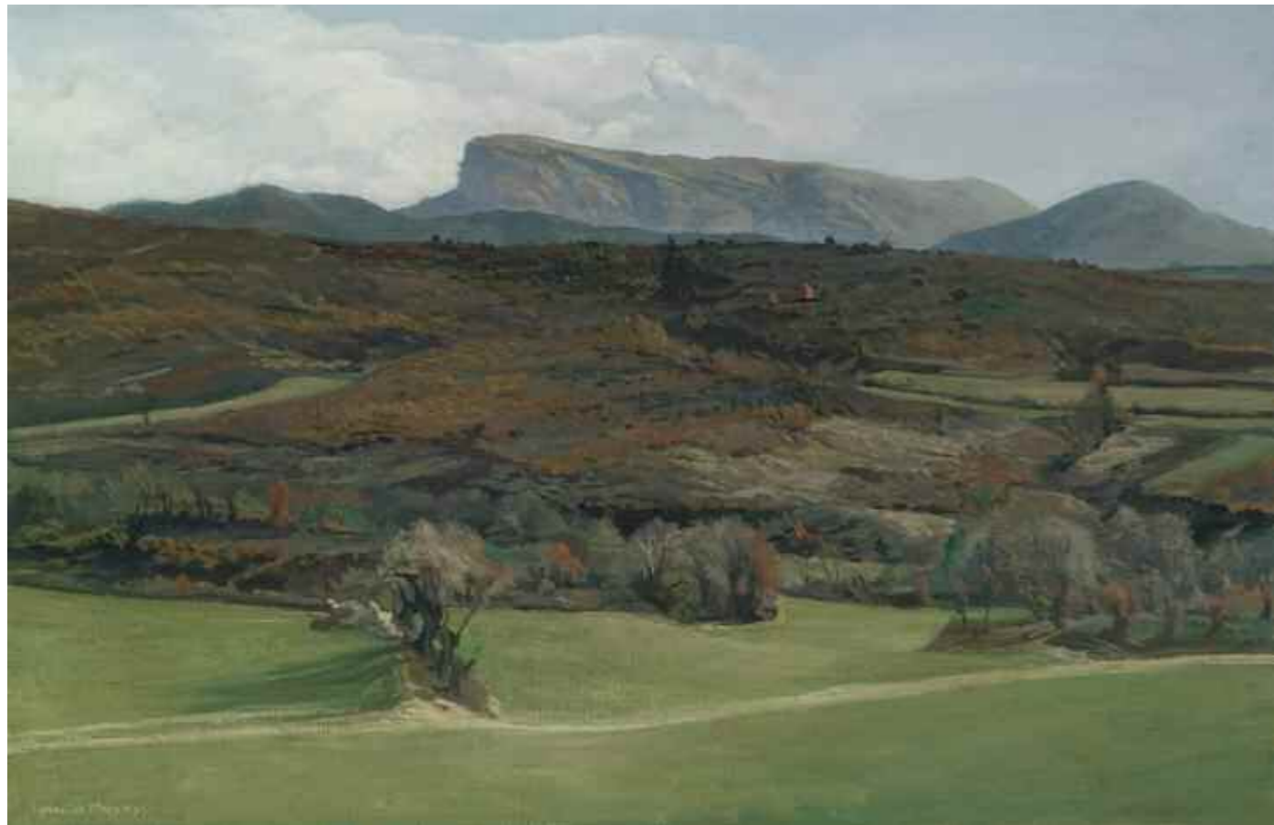
Peña Oroel, 2004. Colección Enate