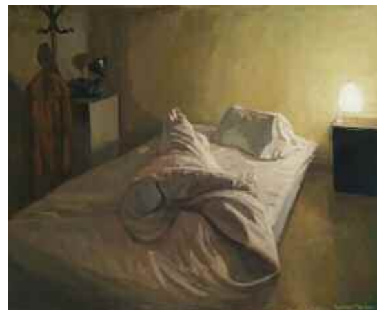
Cama deshecha, 2006. Colección Enate