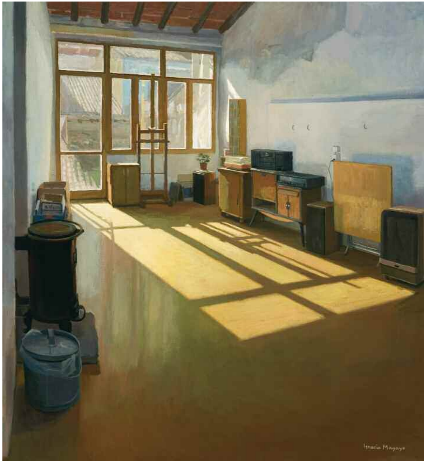
Estudio, 2006. Colección Enate