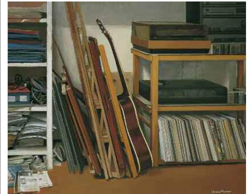
Rincón del estudio, 1990.