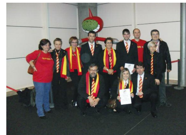
Expedición aragonesa con el Jefe de servicio y la Directora General de Formación Profesional